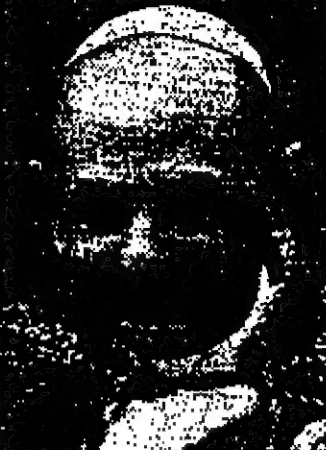
تصية جديدة تواجه ويسلون

تحت إشراف روبرت - وولف... وقد بعدد القديسين أبا أولئك الذين ارتكبو الخطأ أو نوع هذه الأخطاء غير أنه يعتقد أن بينهم هؤلاء القديسين الذين يعتقدون أن الكنيسة هي التي يجب أن تكون على ما يعتقد أراه غير مستقيمة... وقال اليابا أمس أنه على الرغم من أن هذه الأمور كثيرة في الكنيسة تحتاج إلى ترميم بحيث تسير روح العصر فإن هناك أمور لا يجوز الإفراط فيها... وأضاف يقول إن طين القرنين هما صلب الإيمان الذي اكتسبه القديسون الكنيسة والقرنين السبعين كنيسة وما يتبعها من طاعة للكنيسة والرواية التي أسسها المسيح والتي طورها حكمة الكنيسة ووسمها.